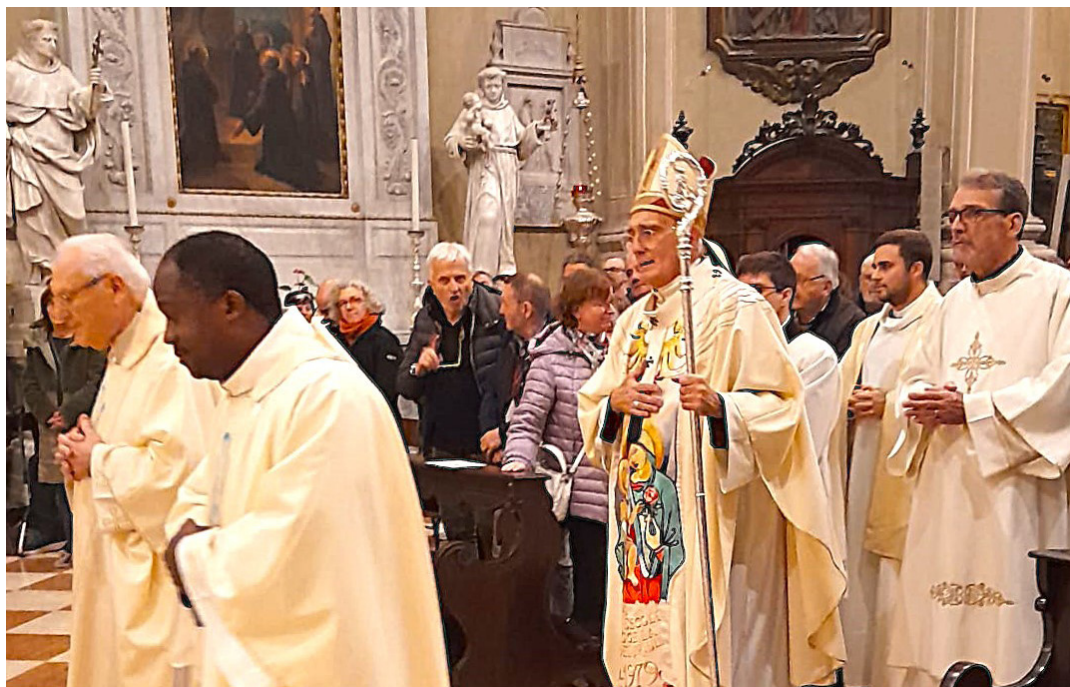
26 ottobre - Voto cittadino presieduto dall'Arcivescovo mons. Riccardo Lamba.