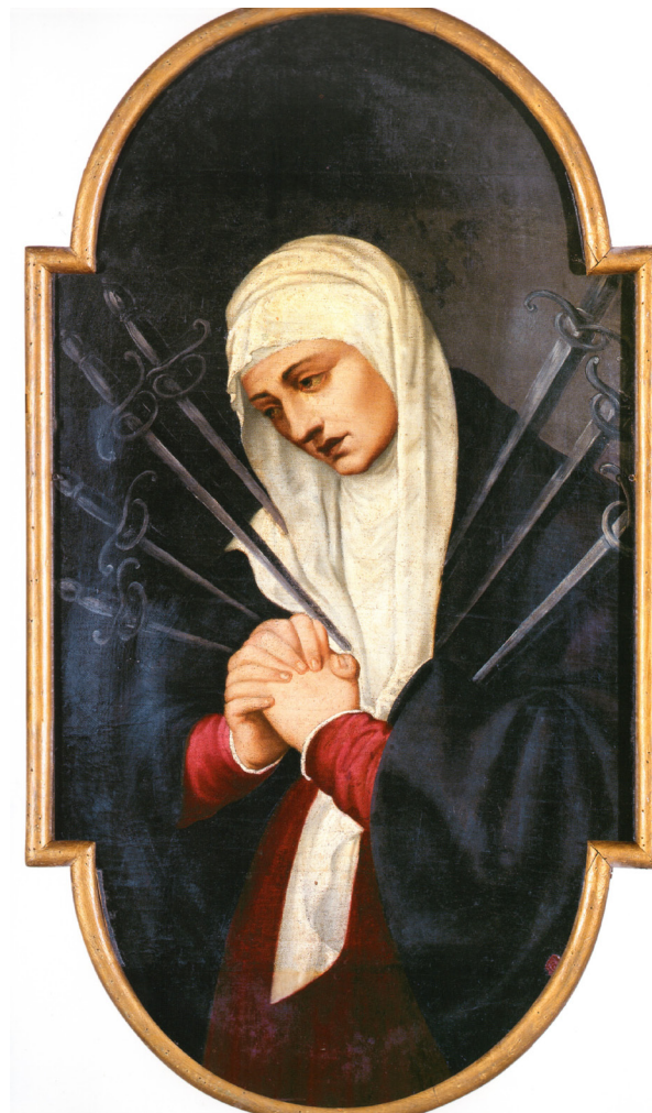
Scuola del Tiziano (XVI sec.): Addolorata. Senigalia, Chiesa di S. Martino.