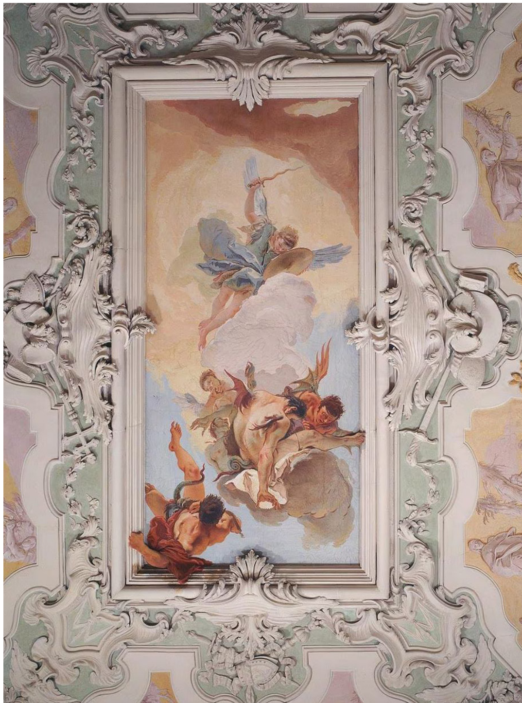
Giovan Battista Tiepolo, Caduta degli angeli ribelli, 1726-29. Palazzo Patriarcale, Udine.