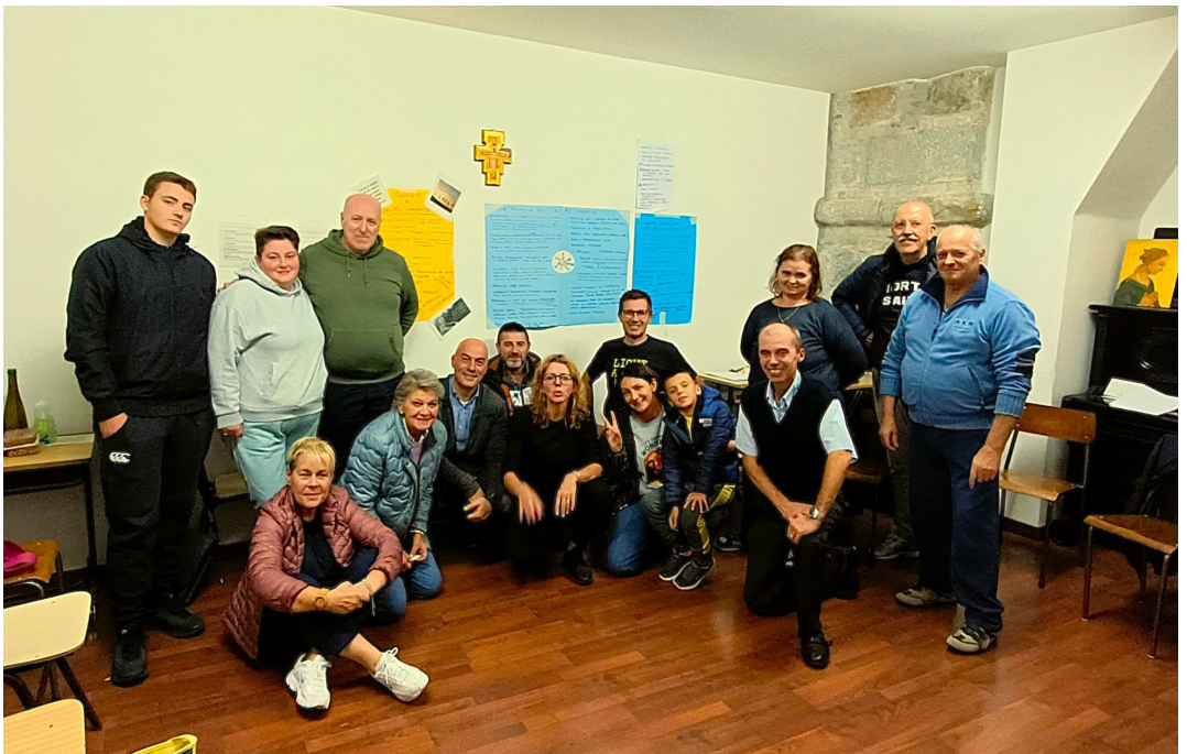
30 settembre - Riunione di programmazione del "Gruppo operativo" della parrocchia.