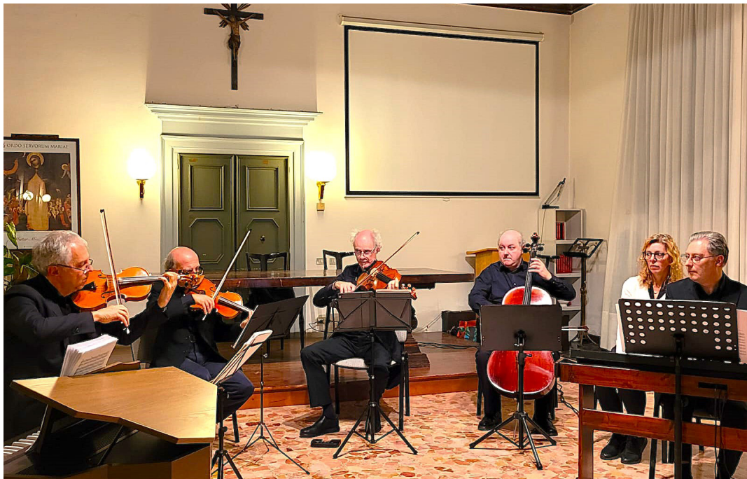
3 ottobre - Concerto "Splendori barocchi" a cura del complesso musicale "Gli Archi del Friuli e del Veneto".