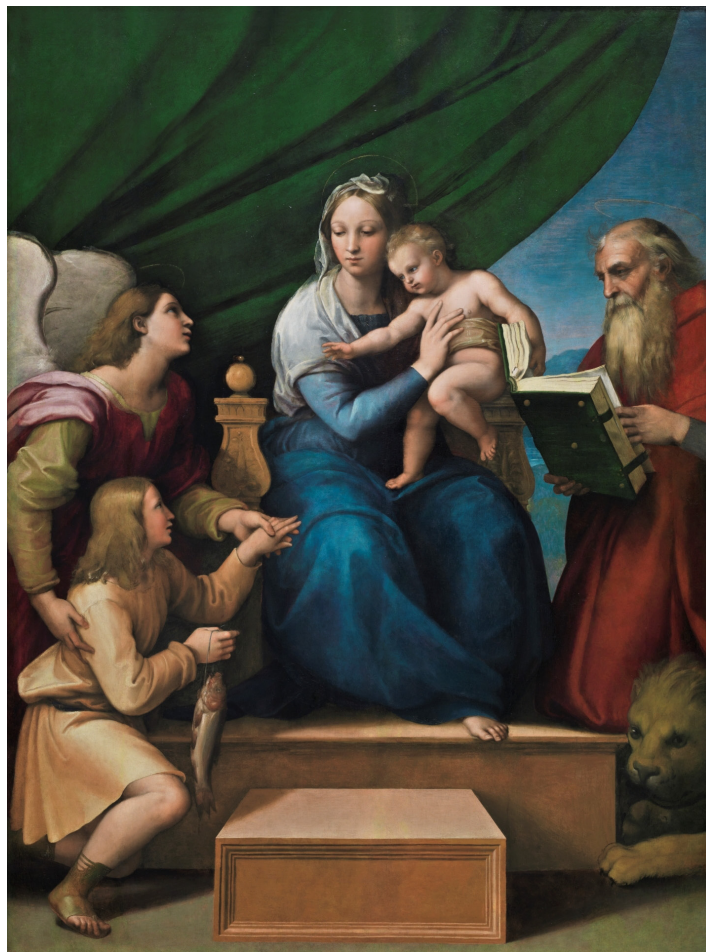
Raffaello Sanzio (Urbino, 1483 – Roma, 1520): Madonna del Pesce, 1514, Museo del Prado di Madrid.