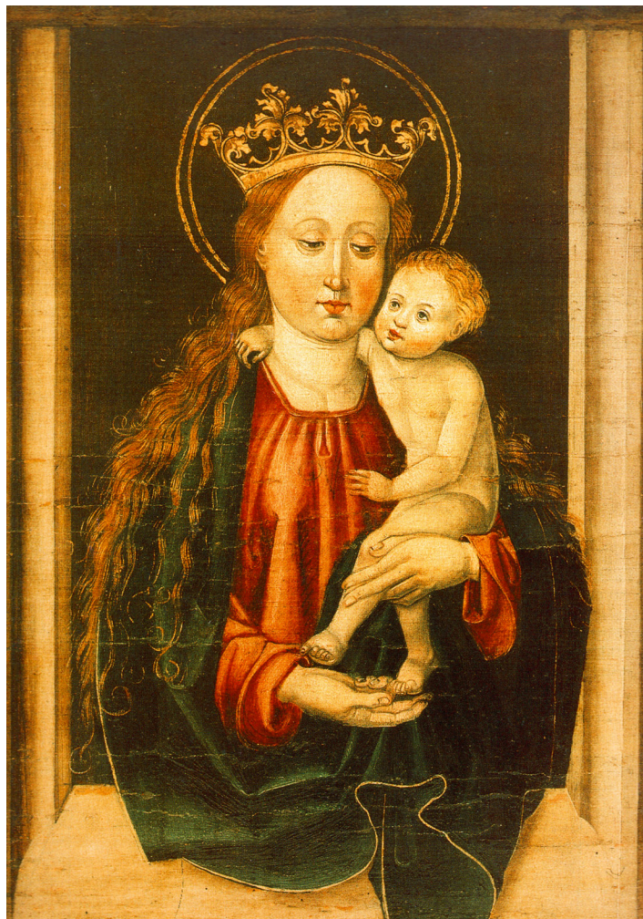
Maestro dell'altare di Halle (1488): Madonna con Bambino. Magdeburg, Wallonerkirche, proveniente dalla chiesa dei Servi di Maria di Halle (Germania).