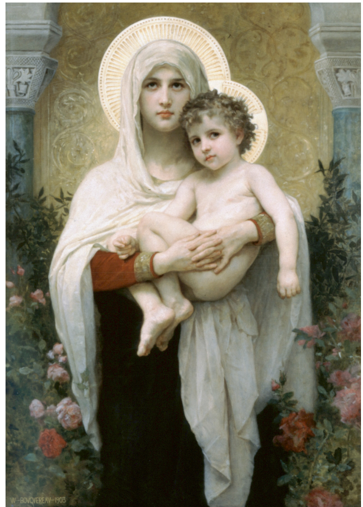
William-Adolphe Bouguereau (La Rochelle, 1825 – ivi, 1905): La Madonna delle Rose (1903). Olio su tela, Jay Gould Museum, Tarrytown (New York),