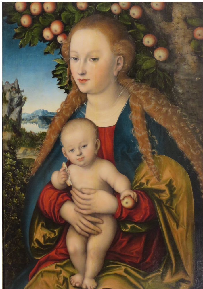
Lucas Cranach il Vecchio (Kronach, 1472 – Weimar, 1553): Madonna con Bambino sotto un melo, 1530 circa, Museo dell'Ermitage di San Pietroburgo.