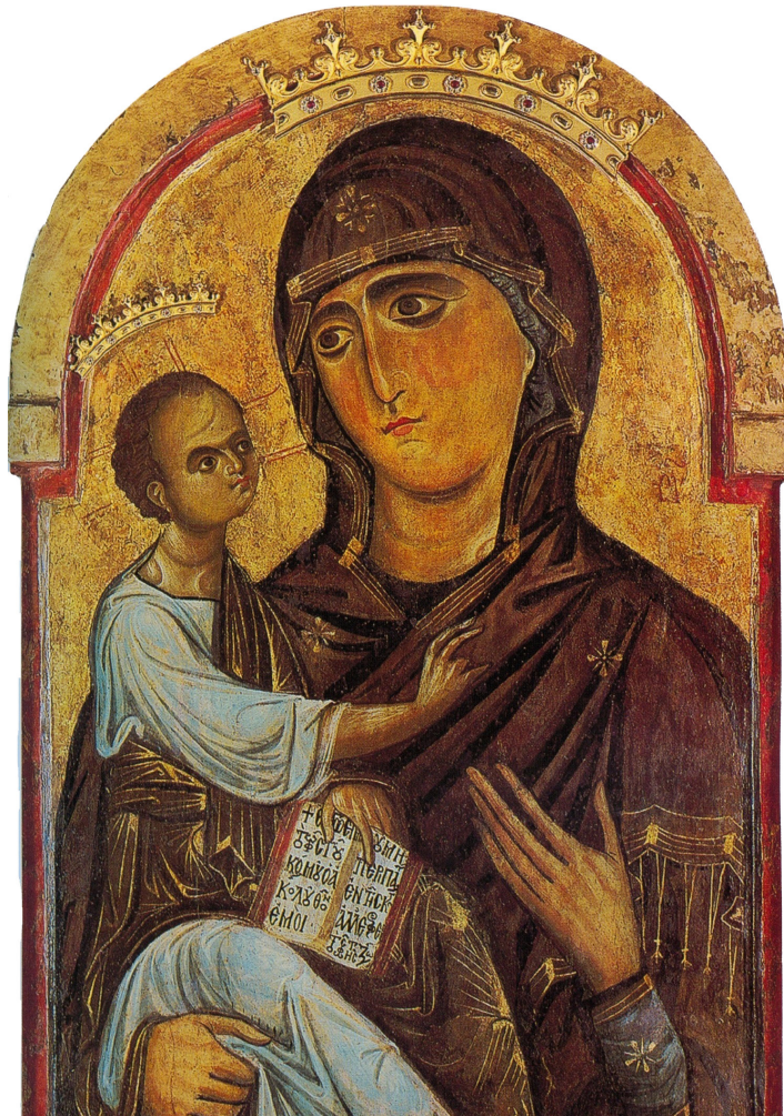
Berlinghiero Berlinghieri (att.) (Volterra, 1175 c. – 1236 c.): Madonna col Bambino. Tempera e oro su tavola, I quarto del XIII secolo, Cattedrale di Pisa