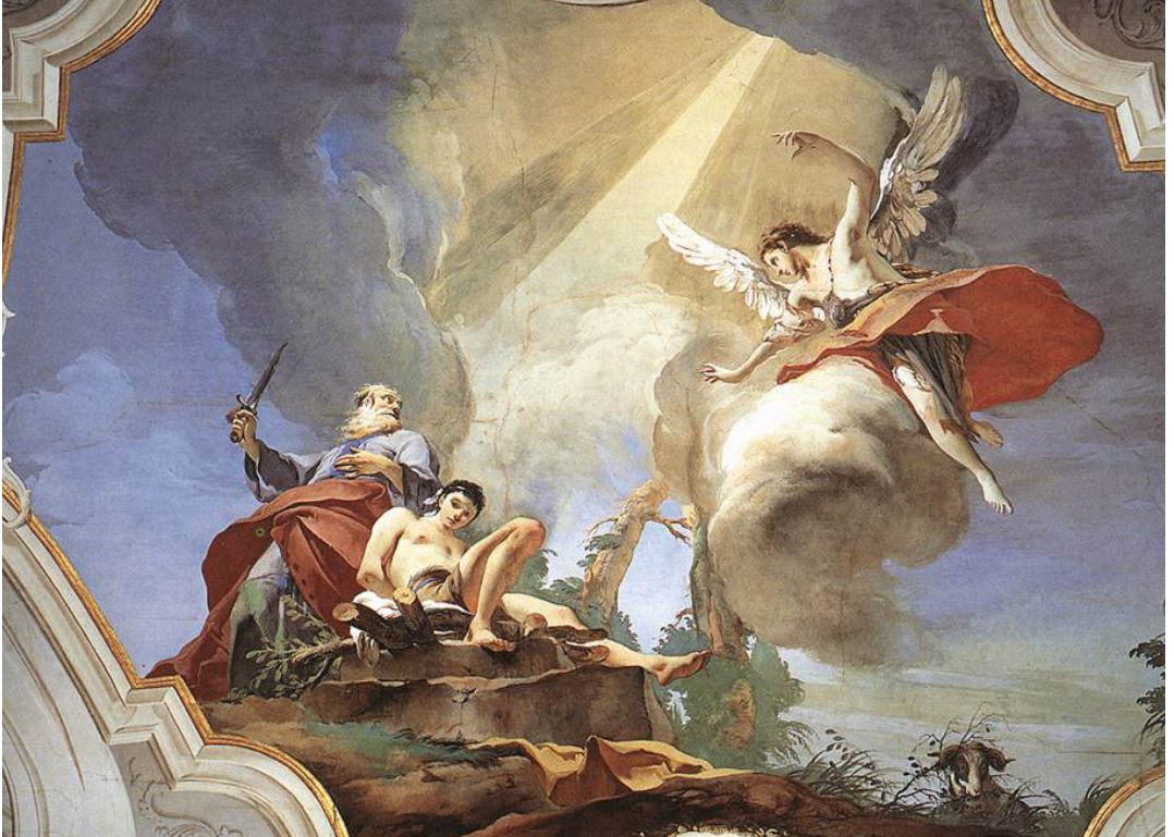
Giovan Battista Tiepolo, Il Sacrificio di Isacco, 1726-29. Palazzo Patriarcale, Udine.

Dio con Abramo inizia un nuovo cammino dell'umanità, in lui, Dio “benedice tutti i popoli della terra” (Gen. 12,3). Inizia la storia della benedizione in Abramo che è storia di salvezza per tutti.