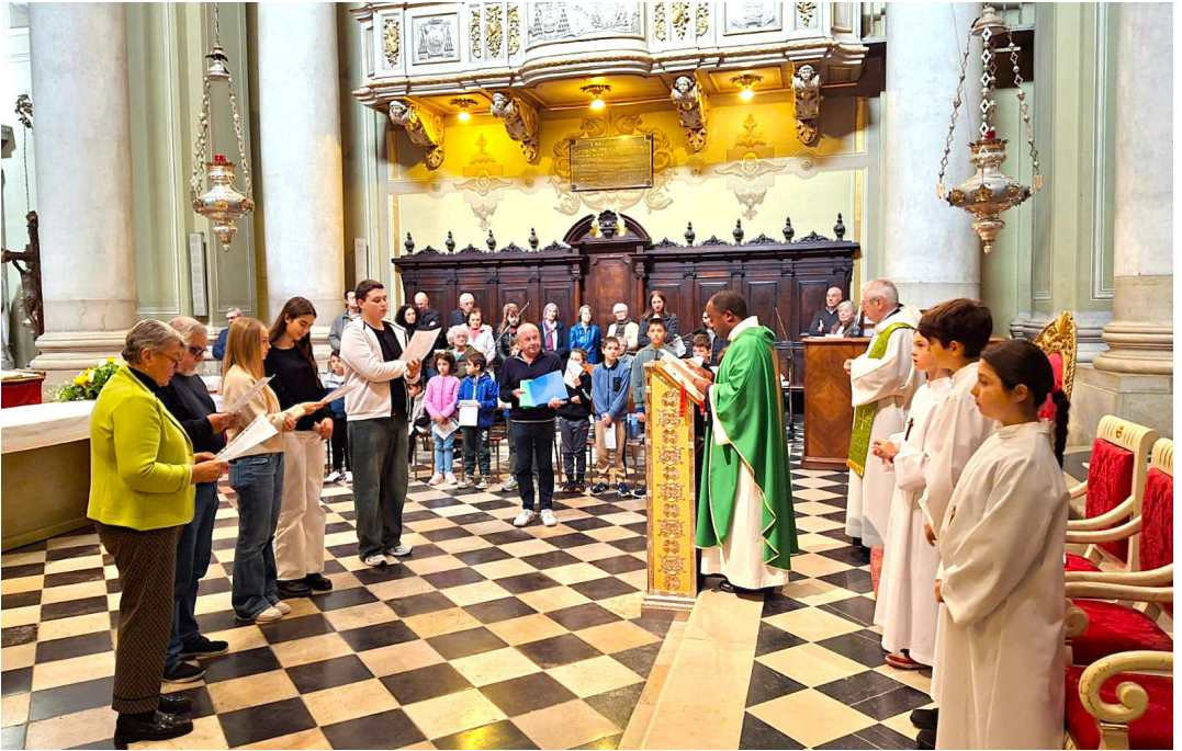
19 ottobre - Consegna del mandato ai catechisti.