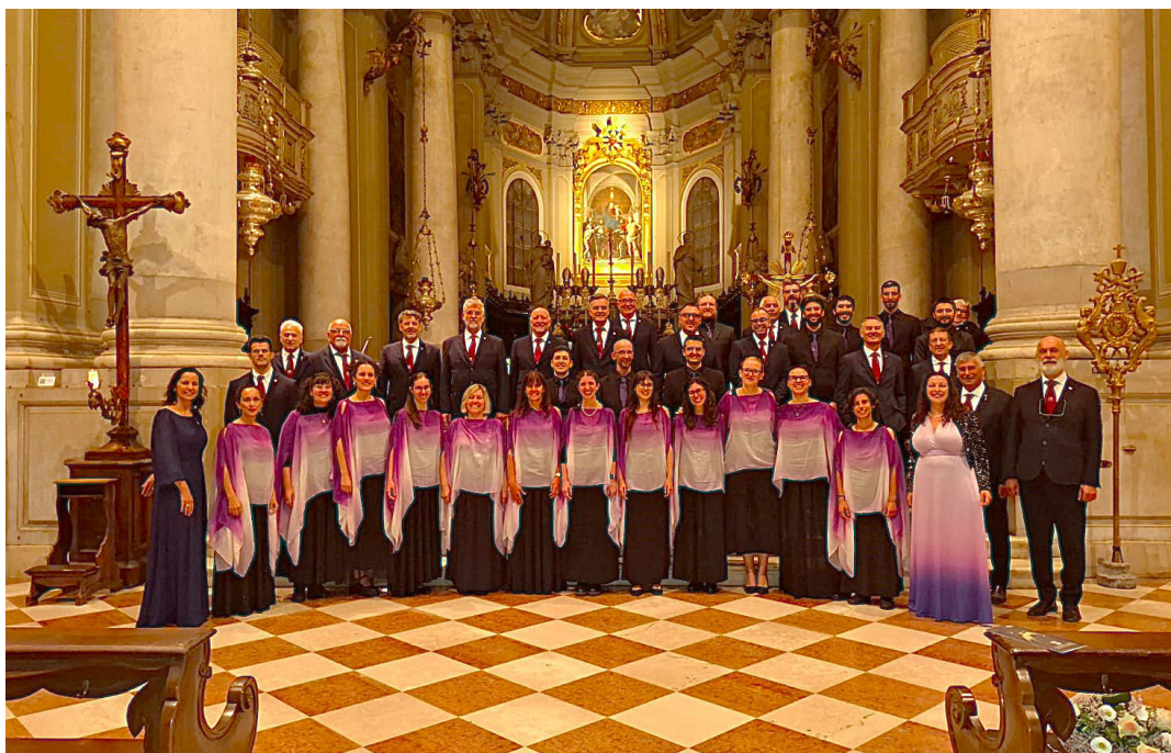
27 settembre - Festival Internazionale "Cori d'Europa 2025". Il Gruppo Polifonico Claudio Monteverdi di Ruda e il coro Eco Vana Voce della Valle d'Aosta.