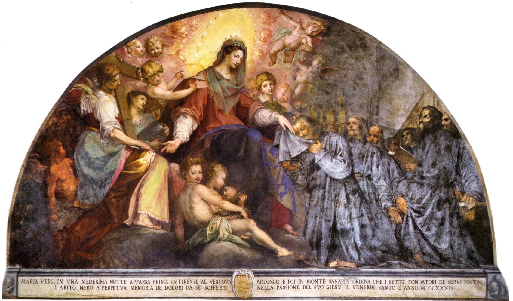
Bernardino Barbatelli detto il Poccetti (Firenze 1548-1612): La Madonna appare ai Sette Fondatori dei Servi di Maria, 1604-1605, Firenze, SS. Annunziata, chiostro grande.