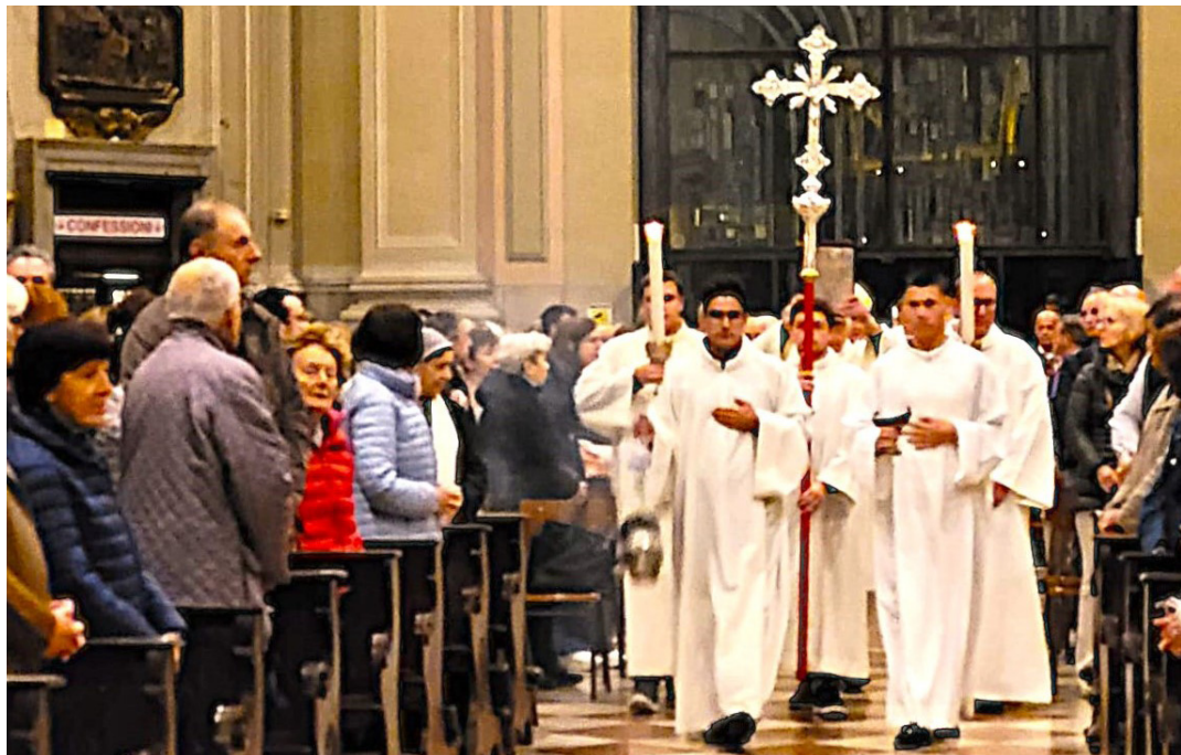
26 ottobre - Voto cittadino. Processione d'ingresso in basilica.