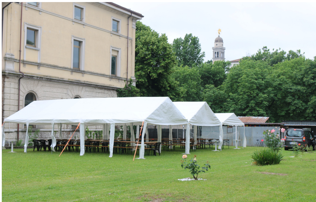
8 giugno - Festa Parrocchiale. La struttura per la festa, montata con l'aiuto di una trentina di parrocchiani.