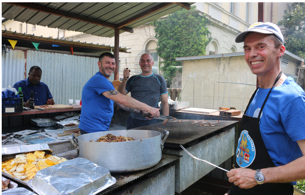
8 giugno - Festa Parrocchiale. Le griglie sono in piena attività.