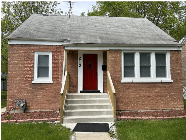
Casa natale di Papa Leone XIV.