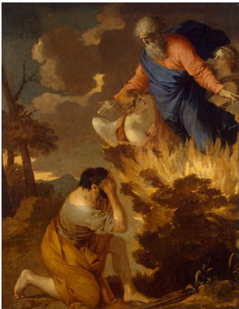
Roveto ardente. Dipinto del XVII secolo di Sébastien Bourdon all'Ermitage, San Pietroburgo.

A Mosè Dio appare presso il roveto e gli dice "Ho osservato la miseria, ... ho udito il grido, ... conosco le sofferenze del mio popolo! ... (Esodo 3,7): non è un Dio indifferente, ma coinvolto con l'umanità. A Mosè che gli chiede quale sia