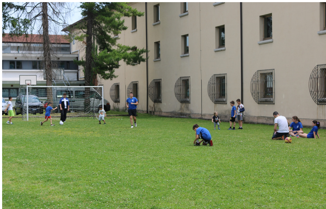
8 giugno - Festa Parrocchiale. Momenti di gioco con i ragazzi.