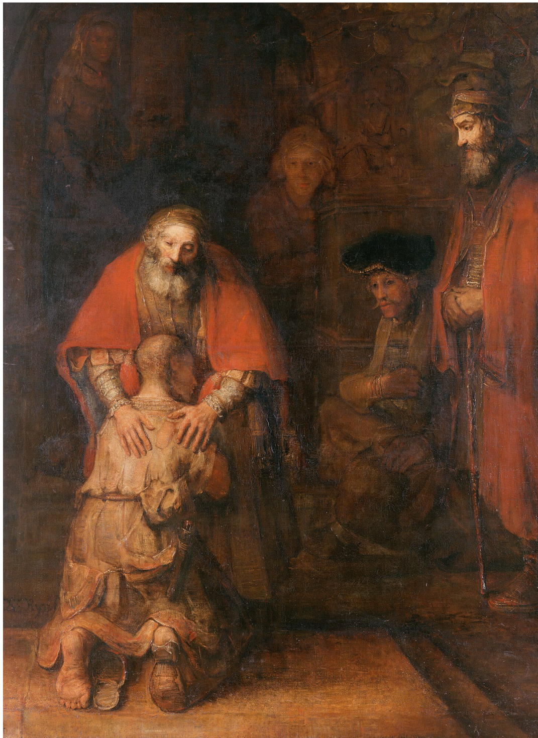
Ritorno del figliol prodigo. Dipinto a olio su tela (262x206 cm) di Rembrandt, databile al 1668 e conservato nel Museo dell'Ermitage di San Pietroburgo.