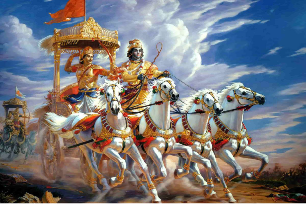
Immagine dal Bhagavad Gita.

Alla domanda posta da una persona: “si può vivere senza un dio?”, la risposta è molto semplice: “sì, si può vivere senza un dio ufficiale, salvo poi farsene uno personale di comodo”.