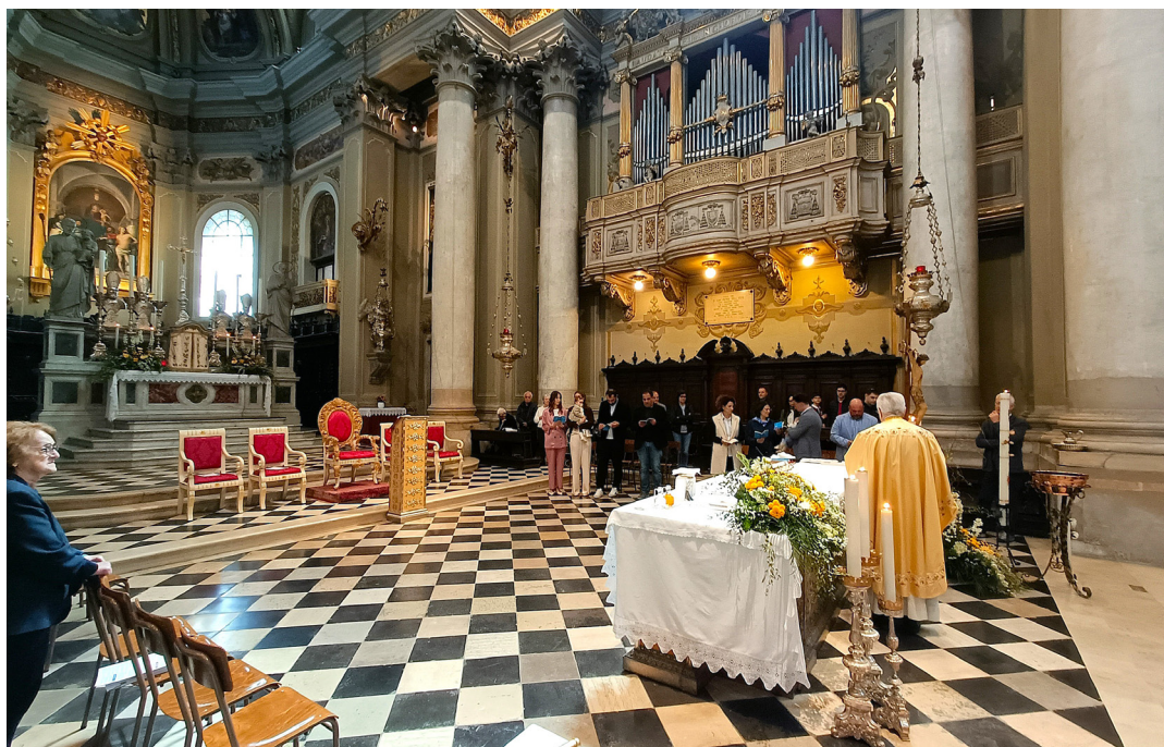
27 aprile - Due battesimi durante la messa parrocchiale.