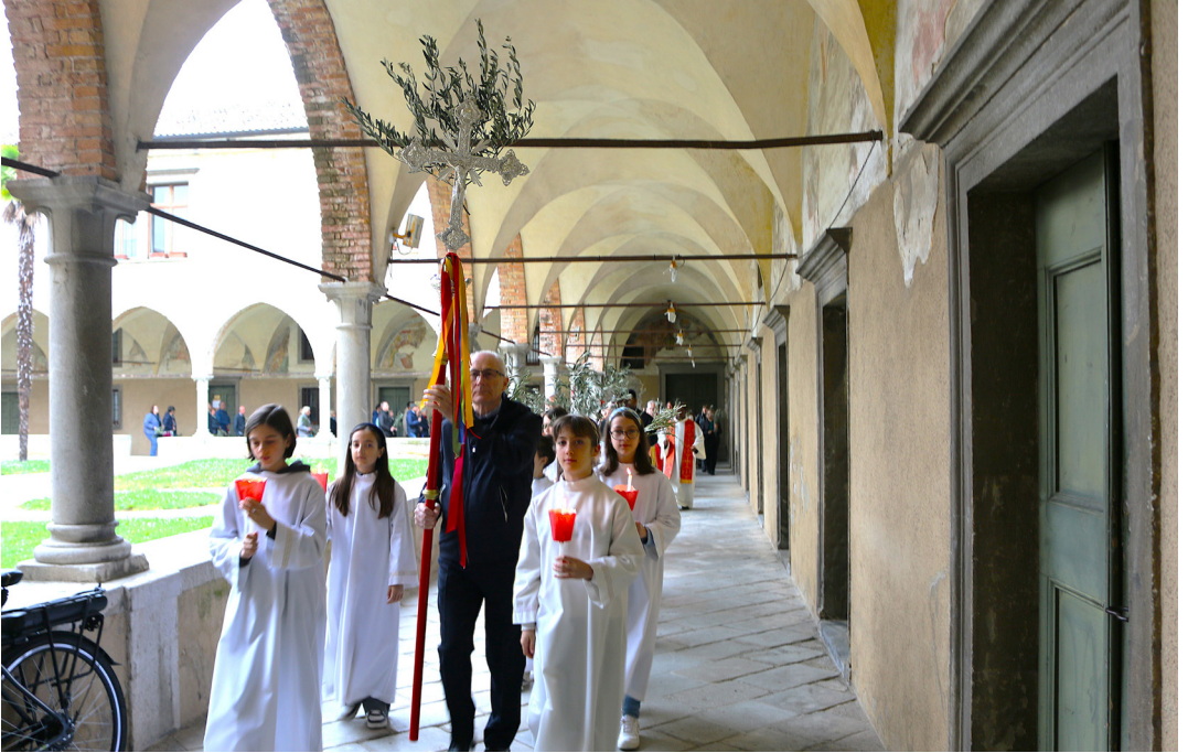
13 aprile - Domenica delle Palme. Processione