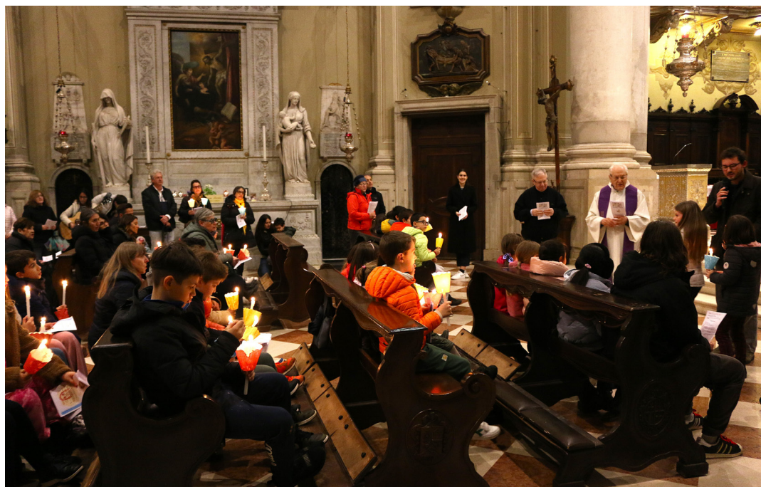
13 marzo - Giubileo dei ragazzi della CP.