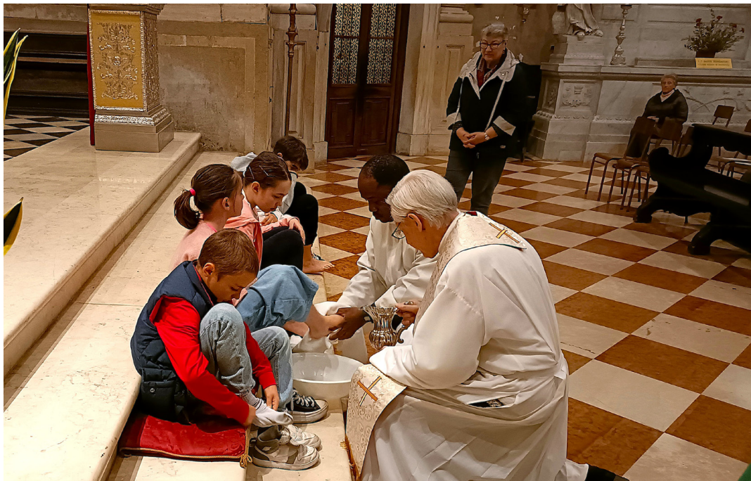
17 aprile - Giovedì Santo. Lavanda dei piedi.