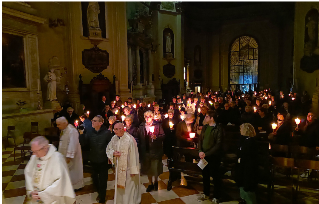
19 aprile - Veglia di Pasqua. Lumen Christi.