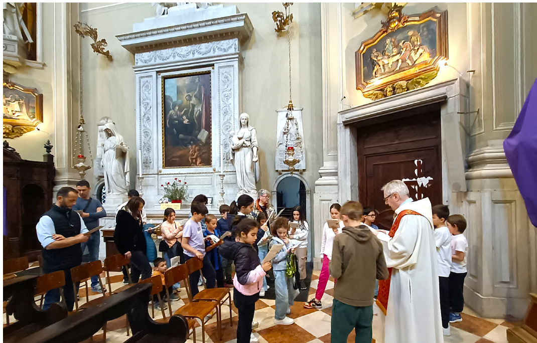
12 aprile - Via Crucis con i ragazzi del catechismo.