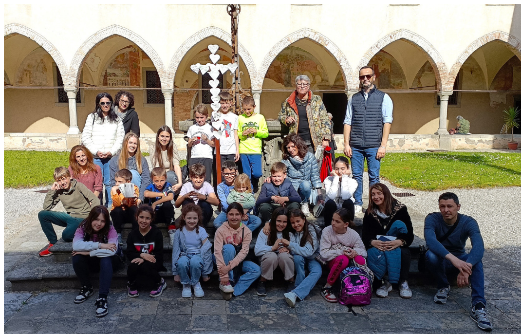
6 gennaio - Recita dell'Epifania con i ragazzi e le famiglie del catechismo.