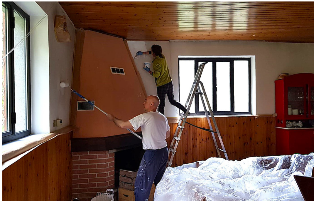
27 aprile - Lavori alla casa montana di Culzej in vista dei campeggi parrocchiali.