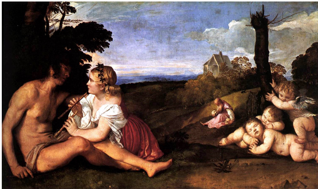
Tiziano. Le tre età dell'uomo . 1512. National Gallery of Scotland di Edimburgo.

nuovo. Ciò vale ad esempio per le singole fasi della giornata: il mattino, il mezzogiorno o la sera; ... o anche per una stagione che si distingue da quella appena trascorsa... E ogni volta l'uomo è un altro, anche solo nel senso che un dato periodo della vita è unico e non ritorna più... In effetti la tensione dell'esistenza e il pungolo che dal profondo ci muove a viverla stanno proprio nel fatto che ogni fase della vita è nuova, non era mai accaduta prima, è unica, e poi passa per sempre.» 1