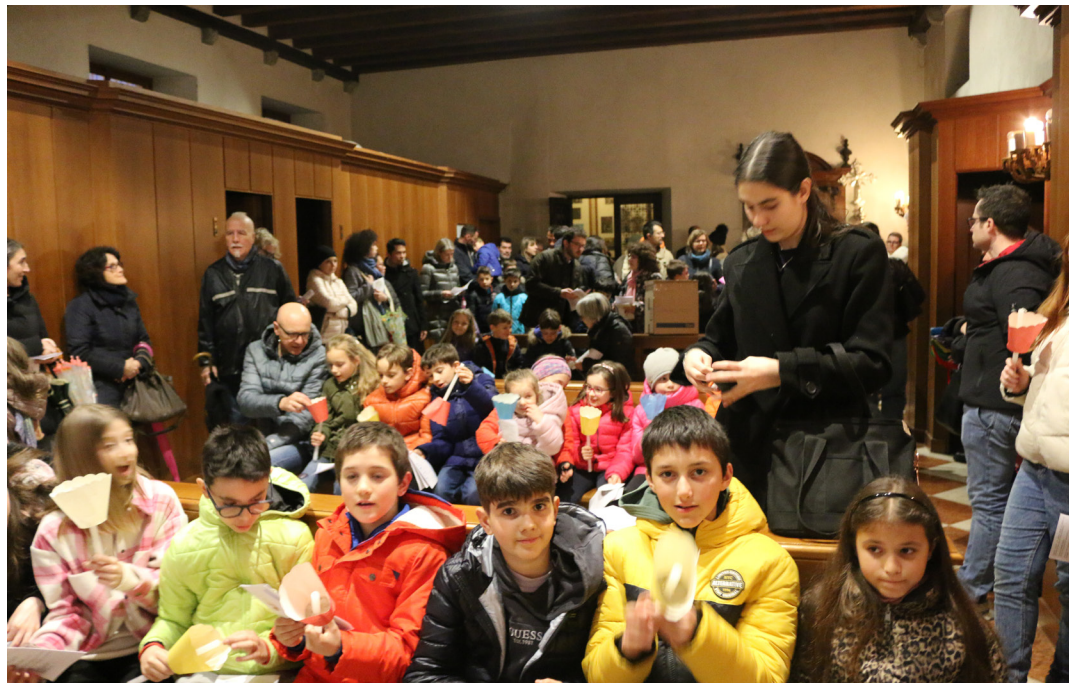
13 marzo - Giubileo dei ragazzi della CP.