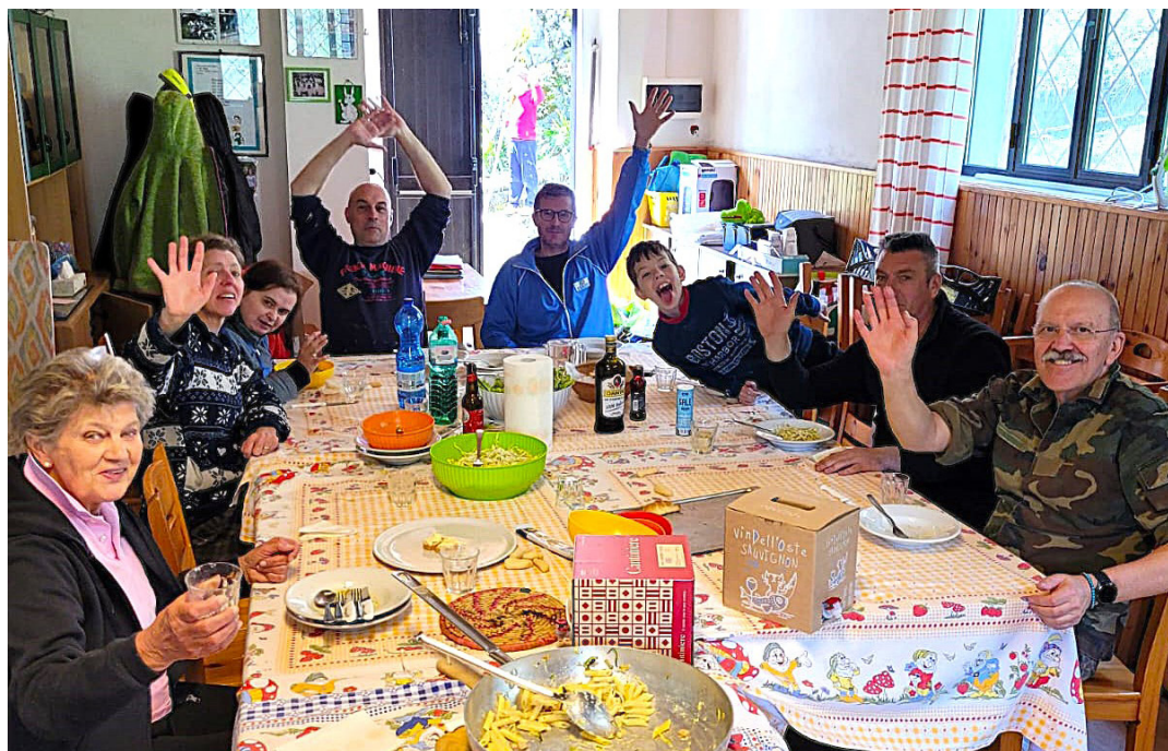
27 aprile - Pranzo dopo i lavori a Culzej.