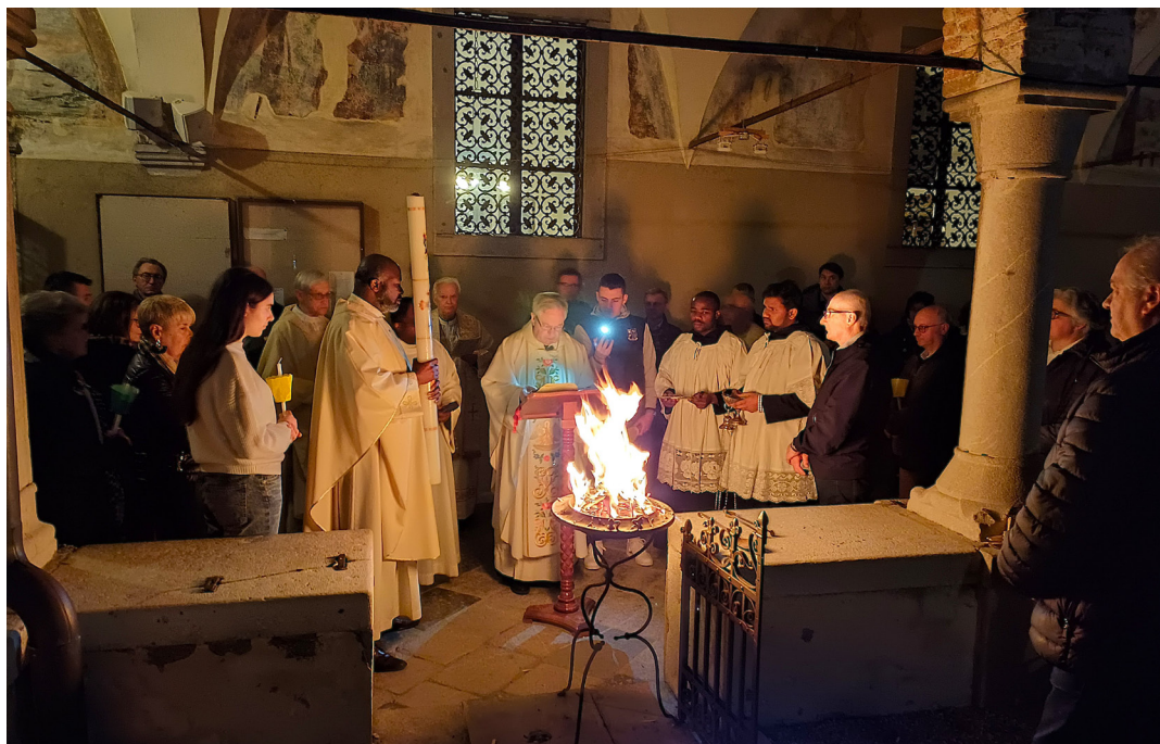
19 aprile - Veglia di Pasqua. Benedizione del fuoco.