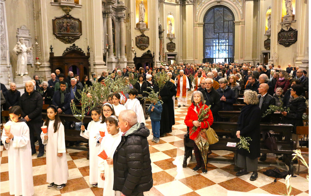
13 aprile - Domenica delle Palme. Ingresso in chiesa.