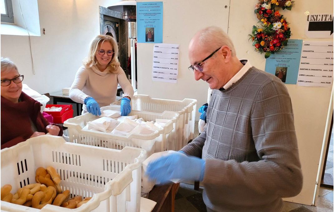
12 febbraio - Volontari preparano il pane per San Valentino.