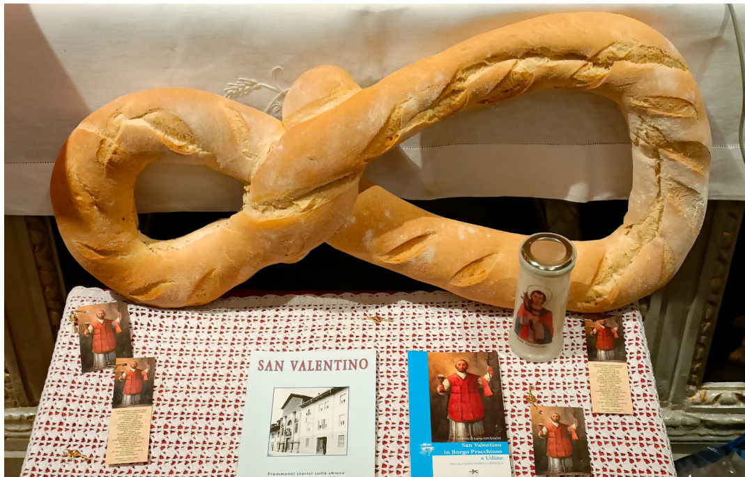
13 febbraio - I tradizionali oggetti devozionali di San Valentino pronti per la benedizione.