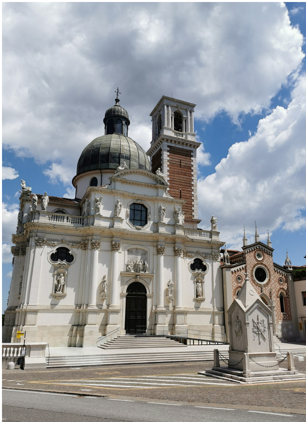
Santuario di Monte Berico a Vicenza