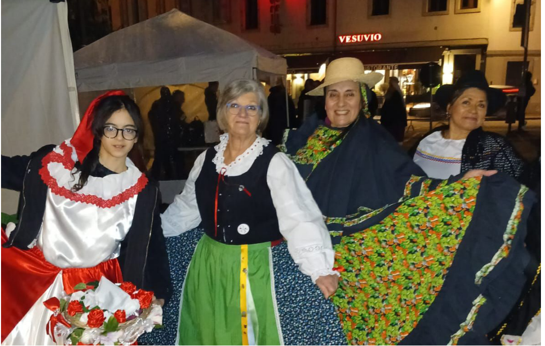
14 febbraio - Gruppo folkloristico alla festa di San Valentino.