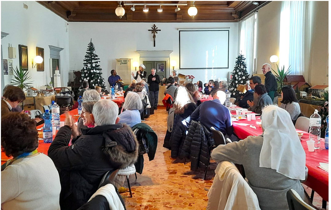
12 gennaio - Pranzo di ringraziamento per tutti i collaboratori alle attività di Avvento e Natale.