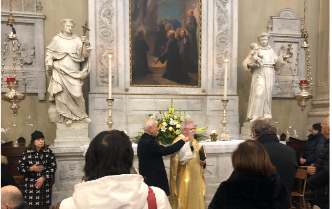
16 febbraio - Commemorazione dei Sette Santi fondatori durante la messa parrocchiale.