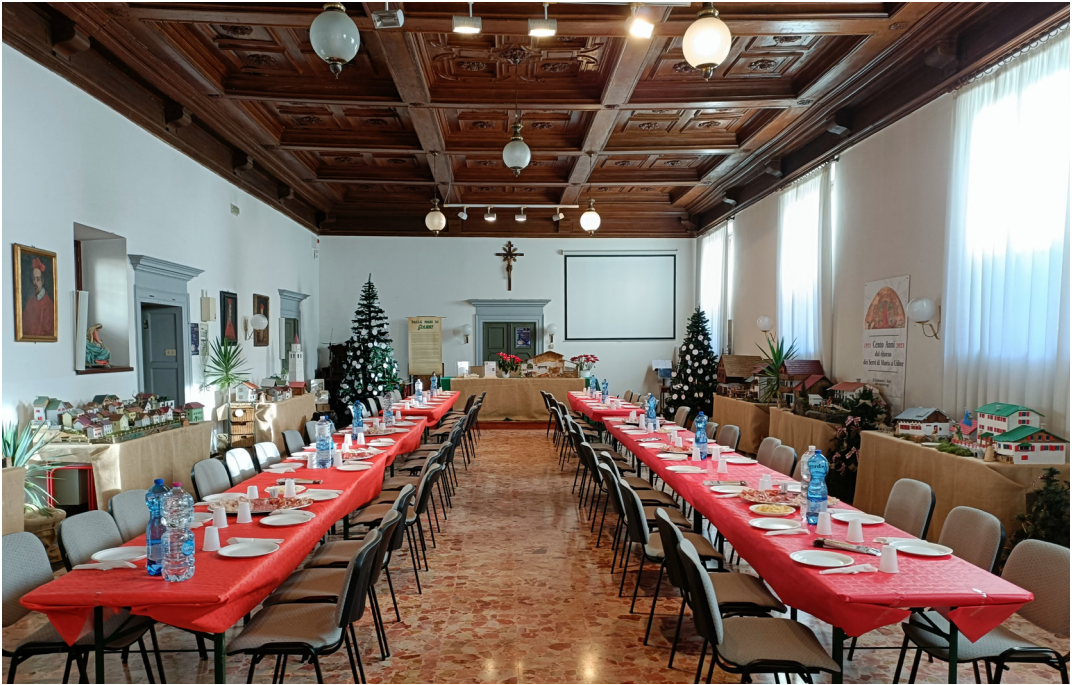
12 gennaio - Preparativi per il pranzo di ringraziamento per tutti i collaboratori alle attività di Avvento e Natale.