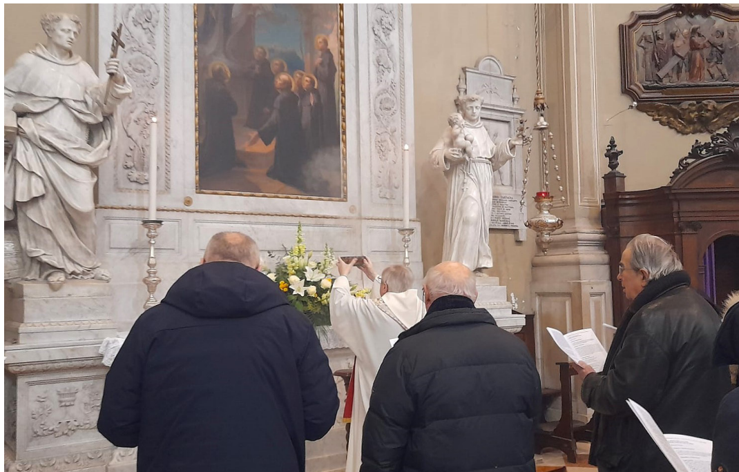
17 febbraio - Frati e clero udinese per la celebrazione nella festa dei Sette Santi Fondatori.