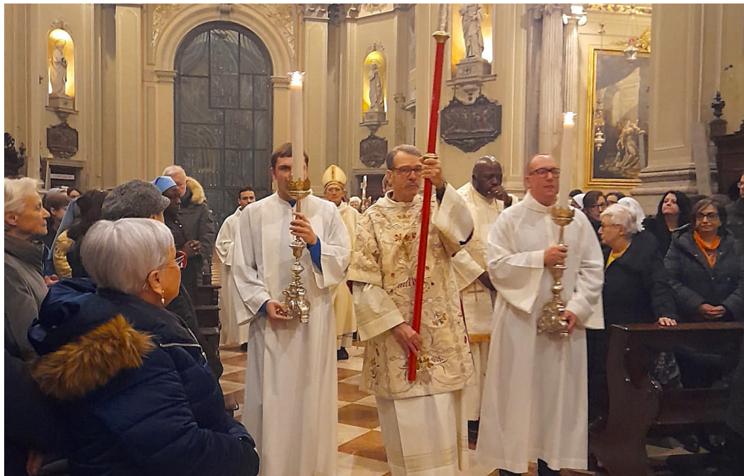
1 febbraio - Giornata diocesana per la vita.