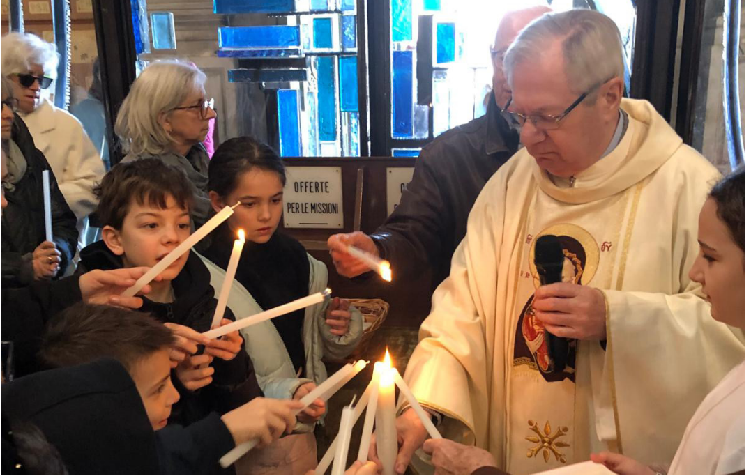
2 febbraio - Madonna candelora.