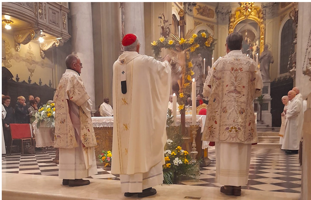
1 febbraio - Giornata diocesana per la vita. La messa celebrata dall'Arcivescovo, a cui è seguita l'adorazione eucaristica per tutta la notte.