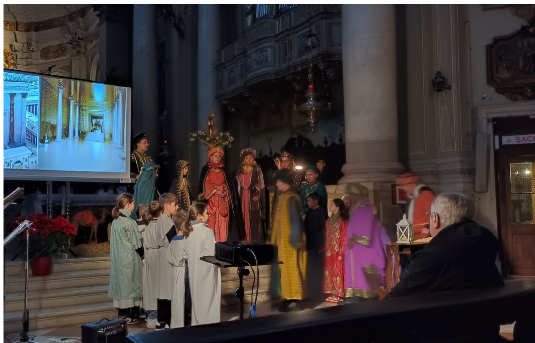
6 gennaio - Recita dell'Epifania con i ragazzi e le famiglie del catechismo.