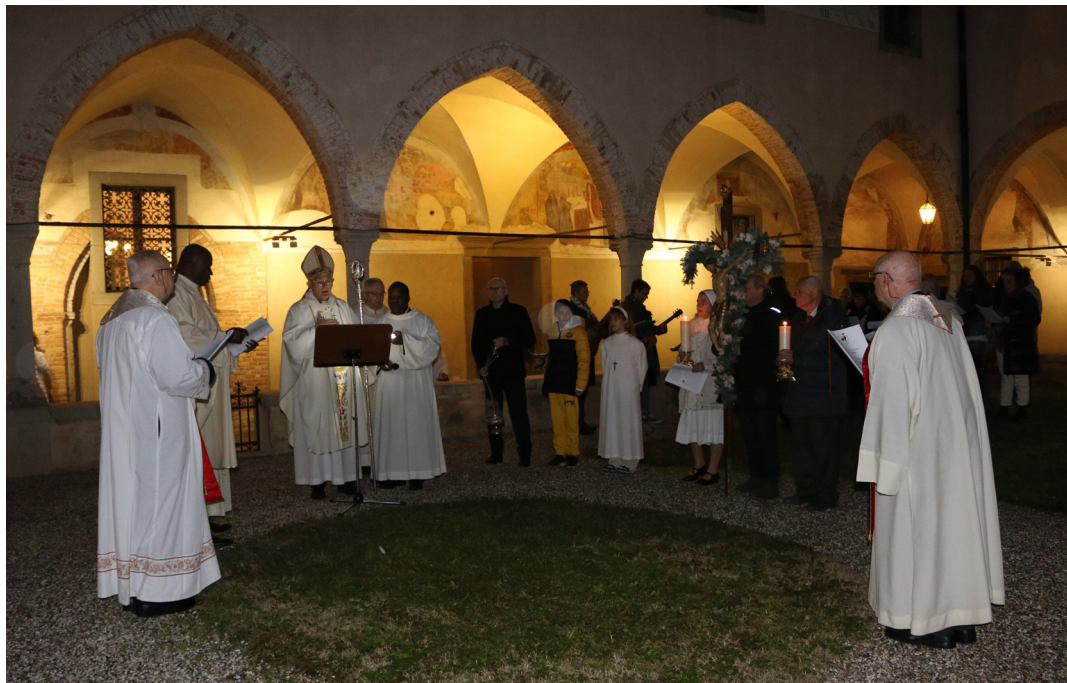
5 gennaio - Apertura dell'anno giubilare alla Madonna delle Grazie.