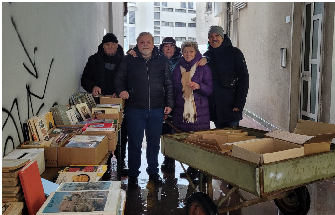
14 febbraio - Nonostante il tempo avverso, il mercatino del libro usato a sostegno della biblioteca del convento è stato fatto, con ottimi risultati.